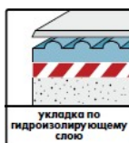
укладка по гидроизолирующему слою