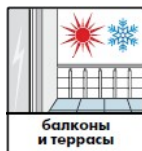
балконы и террасы