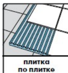
плитка по плитке